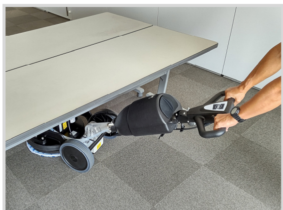
▲ テーブルの下などはハンドルを倒せばスムーズに洗浄できます